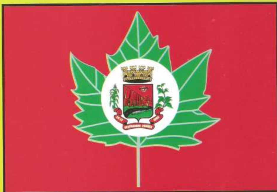
Bandeira do Município de Vespasiano Corrêa